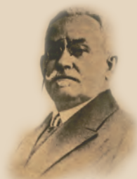
Słowo od Zarządu Kasy Stefczyka