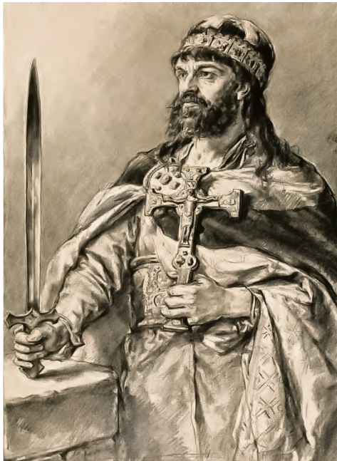
» Mieszko i Dobrawa

To rozróżnienie jest ważne również z innego powodu. Chrzest Mieszka nie był zamknięciem procesu, lecz jego początkiem. Dopiero po nim przysłała codzienna, mozolna praca Kościoła: nauczanie wiary, tworzenie wspólnot, organizacja liturgii, budowa pierwszych biskupstw i świątyń. W tym sensie rok 966 był jak zasianie ziarna, z którego wyrosła polska chrześcijańska kultura. Nie wszystko dokonało się w jednej chwili, ale właśnie tamta chwila nadała kierunek całemu dziejom. Z tej perspektywy określenie „chrzest Polski” nie jest